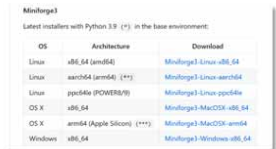
図1. Miniforge のダウンロードページ。インストールする PC の環境に合ったものを選択する。

「以前人に勧められて Python をインストールしたけど結局使ってないな」という人は、まず、古い Python 製品をアンインストールしてください。アンインストール