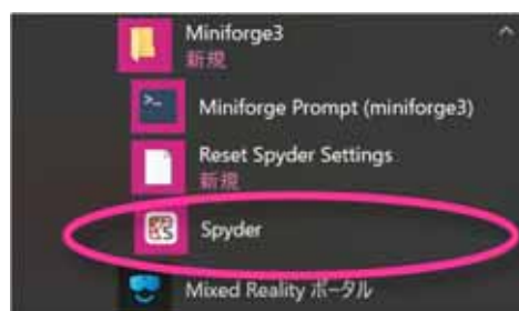
図5. Windows のスタートメニューで「Miniforge3」「Spyder」を選択し、Spyder を起動する。

Spyder は、Python のプログラムを作成したり、それを実行したりするためのソフトウェアです。Windows では、スタートメニューから、Mini forge3 > Spyder を選択してください(図5)。起動に時間がかかりますので、焦らずに待ってください。