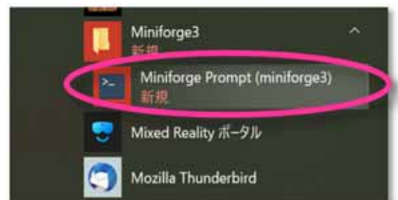
図4. Windows のスタートメニューで「Miniforge3」「Miniforge Prompt」を選択し、Miniforge Prompt を起動する。

次に、以下の文字列を書き込み[Enter]キーを押してください。これでSpyderとモジュールがインストールされます。各モジュール名の後ろには"=1.0.1"等でバージョンを指定します。これらは現時点で動作確認されたものですので、これ以外のバージョンについては保証できません。なお、Spyderについてはバージョンを指定せず、最新版とします。