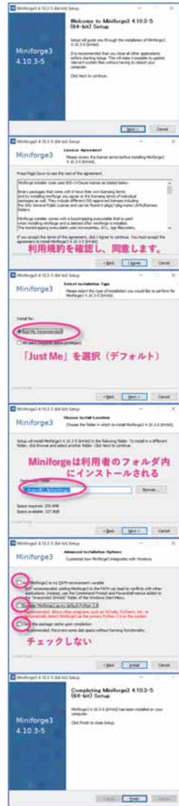
図 3. Miniforge のインストールウィザード。

上記2点が確認出来たら、ダウンロードしたインストーラのアイコンをダブルクリックしてインストールを開始します。基本的には、デフォルトのまま「Next >」ボタンをクリックして進めば大丈夫です。利用者だけがMiniforgeを利用できるようにインストールする方法(インストールウィザードでは「Just Me」と、PCの全利用者が利用できるようにインストールする方法(同「All Users」と)を選択することが求められますが、その時は、前者(デフォルト)を選択してください。図3は、Windows PCに、Miniforgeをインストールしているときのウィザード画面です。図3を参考にインストールを実行してください。