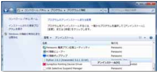
図 2. 古い Anaconda のアンインストール。「プログラムと機能」から Python 3.6・・・)を選択する。

の手順はそれぞれの製品で異なりますが、一般的には、一般のプログラムと同様、コントロールパネルの「プログラムと機能」からアンインストールをします(Windowsの場合)。製品によっては、インストールの際、環境変数に手を加えるものもあるので、そのような場合は、環境変数も綺麗に戻しておいてください。なお、Anaconda3 5.3.1以前のバージョンをインストールしていた場合は、「プログラムと機能」のリストに「Anaconda」とは表示されず、「Python 2.7.x(Anaconda3.x.x)」などのように表示されるので注意してください(図2)。