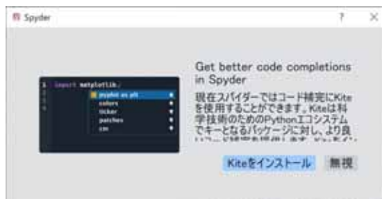
図6. Spyder の初回起動時に表示されるメッセージ。

初回起動時に図6のようにPythonのコード補完を行うツールであるKiteの導入について聞かれますが、無視してかまいません。インストールする場合は「Kiteをインストール」ボタンを押してインストールします。